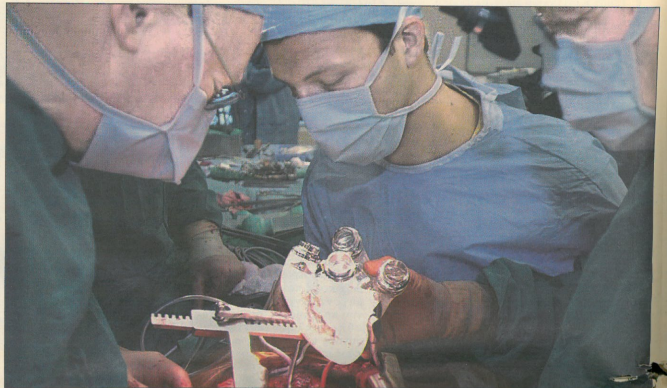
«Ο σωστότερος δρόμος για να ελέγξουμε τον καρκίνο είναι να δραστηριοποιηθούμε περισσότερο στους τομείς της πρόληψης και της έγκαιρης διάγνωσης» γράφει ο Δρ. Παν. Γκινόπουλος

Για μια ακόμα φορά διαπιστώνεται σε παγκόσμιο επίπεδο και επισημαίνεται ιδιαίτερα ότι αν δεν ληφθούν τα επιβεβλημένα και άκρως απαραίτητα μέτρα πρόληψης και έγκαιρης διάγνωσης με σύ-